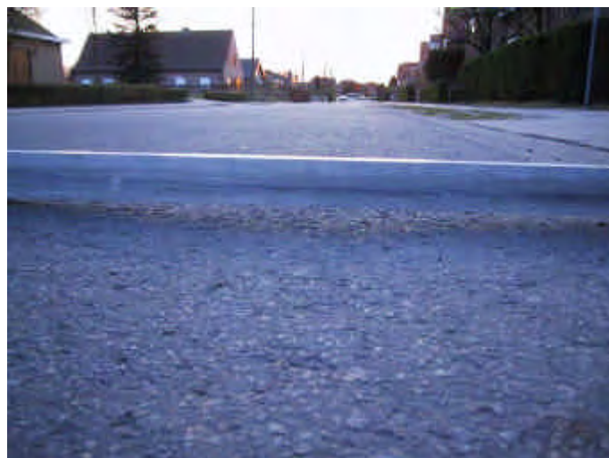
verzakkingen in het wegdek tot een diepte van 3,5 centimeter – toestand is verslechterend