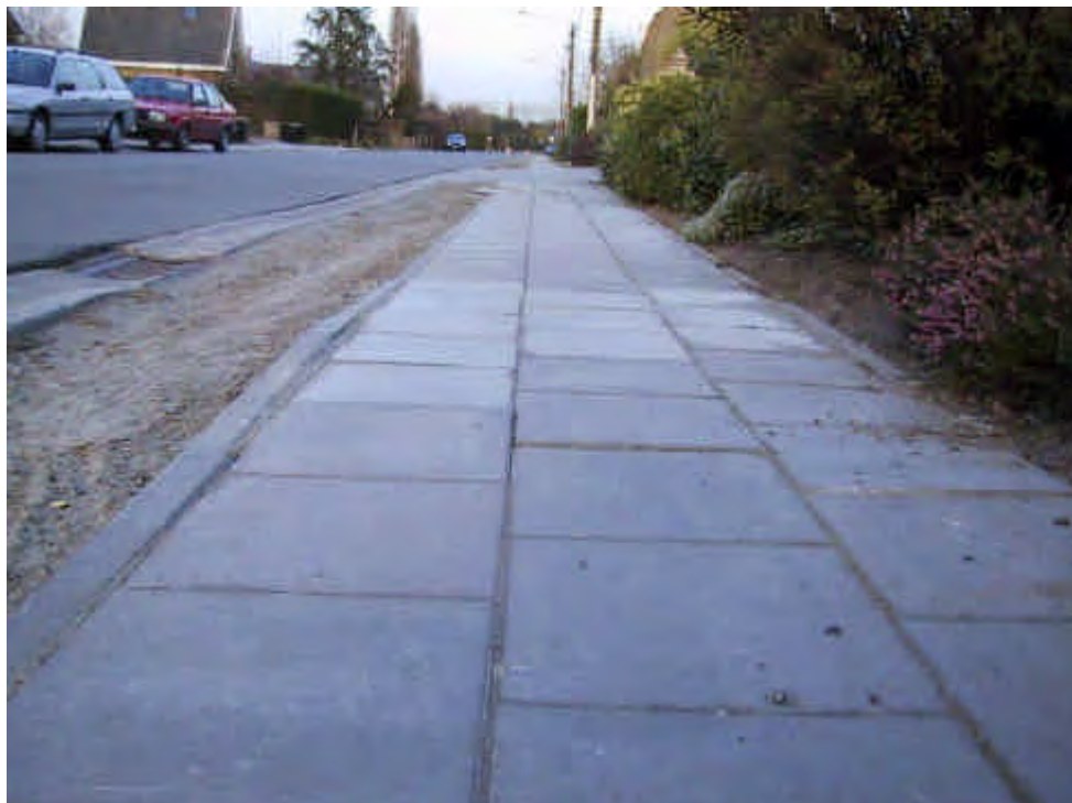
Gebrekkige herstelling van het splinternieuwe voetpad