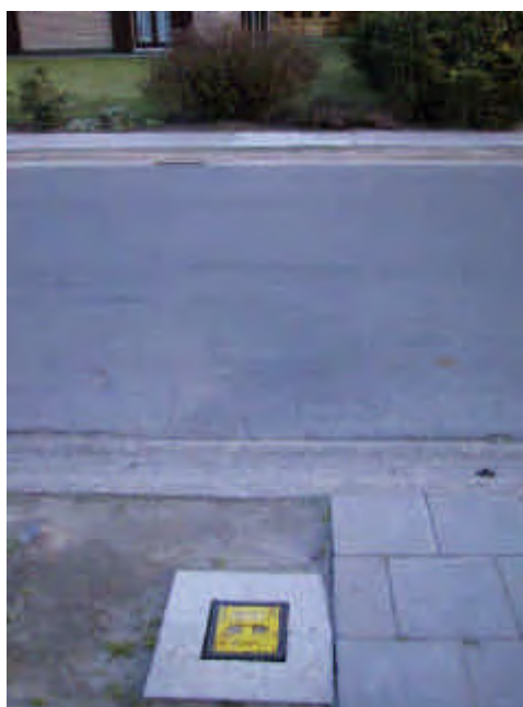
Het gaat hem wel degelijk over verzakking ter hoogte van de uitgevoerde werken in opdracht van VEM (zie gas-aansluitpunt en slecht hersteld voetpad aan de overzijde van de weg)